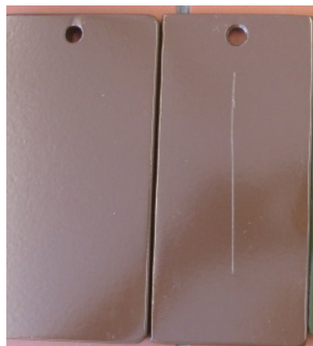
Si 57® E with and without cut BEFORE testing

The width of the cut has not exceeded 1mm.